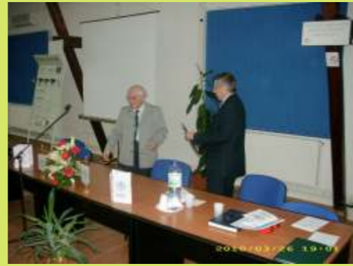
Két évtized Szentgyörgyön

Ennyi és még nincs vége, mondhatná bárki arra a húsz évre, amely alatt folyamatosan tevékenykedett az EMT Sepsiszentgyörgyön.